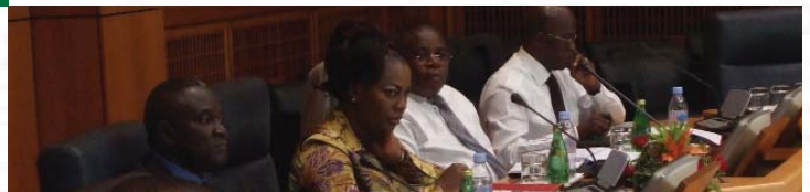
Le Comité Exécutif : Cap Sur Le Nord Les Membres Associés Sont Invités À Joindre Le Comité Exécutif