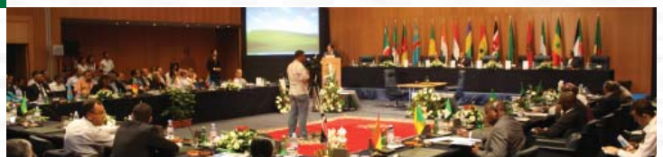
Le premier colloque des Ressources Humaines de l'ARA, fut un succès