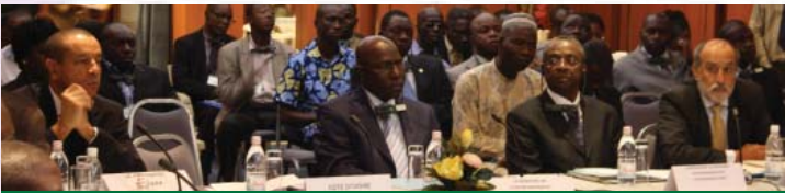
Réunion BAQ pour l'Afrique du Centre et de l'Ouest: Echéanciers AFRI proposés